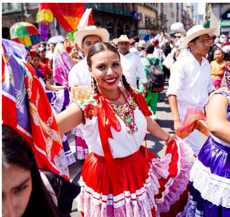
@TabascoJavier · 18h en el #Zócalo de la #CDMX para acompañar a la doctora en el inicio de su campaña a la Presidencia. ¡Es un día fiesta y esperanza! #ClaudiaPresidenta

Ahora, su presencia en la capital del país no fue a un llamado de AMLO, fue para apoyar a Claudia Sheinbaum en el inicio de su campaña.