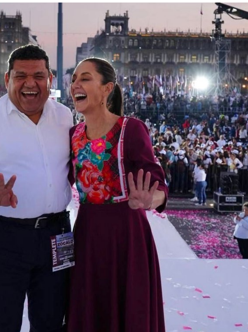
TabascoJavier · 12h que siga la transformación con la doctora en sin duda será la próxima Presidenta de México. ¡Es la mejor! #ClaudiaPresidenta

El primero de ellos fue para denunciar el fraude que había ocurrido en las elecciones en Tabasco, de acuerdo al hoy mandatario federal.