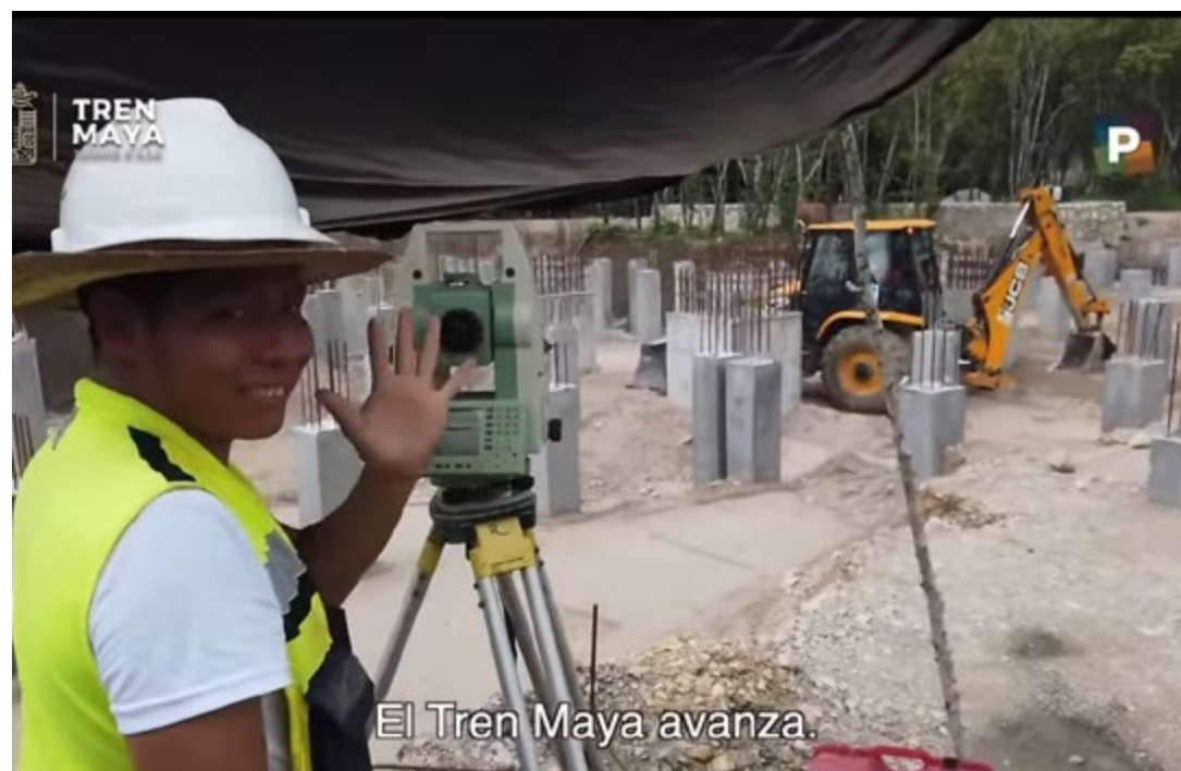
El Tren Maya avanza.

Entre cenotes, vestigios arqueológicos y protestas de ambientalistas la obra no avanza en el tramo correspondiente a Quintana Roo