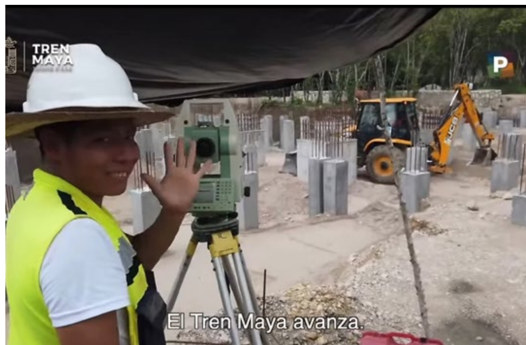
El Tren Maya avanza.

Entre cenotes, vestigios arqueológicos y protestas de ambientalistas la obra no avanza en el tramo correspondiente a Quintana Roo