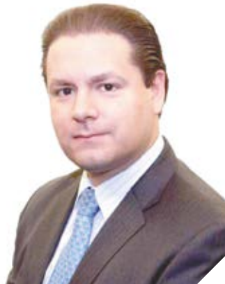
WOLFGANG ERHARDT VOCERO NACIONAL DE BURÓ DE CRÉDITO