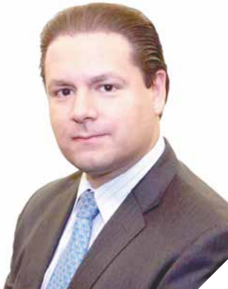
WOLFGANG ERHARDT VOCERO NACIONAL DE BURÓ DE CRÉDITO