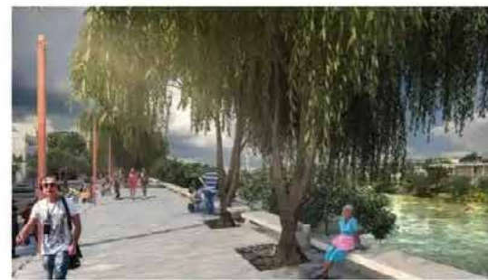
ETAPA 1 ● 2o. semestre 2021