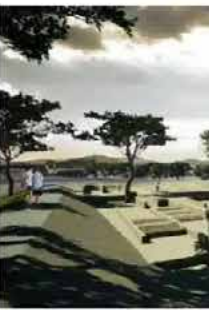
ETAPA 2 ● 2o. semestre 2022

Componentes: Andador Peatonal, Ciclovía, Kioscos Comerciales, Mobiliario Urbano, Arbolado, Alumbrado, Redes Municipales.