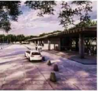
Componentes: Ciclovía, Plaza CICOM, Conexión Peatonal Parque La Pólvara, Andador Peatonal y Paseo Botánico.

se reforzarán ambas dando así mayor seguridad al