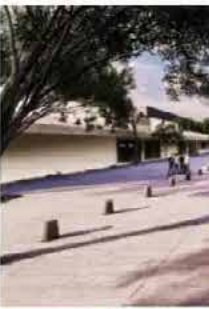
ETAPA 4 ● 2o. semestre 2024

Componentes: Andador Peatonal, Ciclovía, Plaza Sheba, Zona de Restaurantes, Plaza y Teatro al Aire Libre.