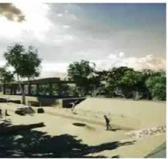
Componentes: Plaza Solidaridad, Centro de Desarrollo Comunitario, Zona Deportes Extremos, Plazas Húmedas y Centro Deportivo.