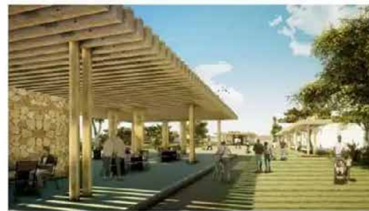
ETAPA 3 ● 2o. semestre 2023